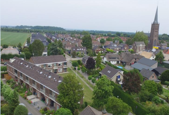
Kloostergaarde, 183 panelen