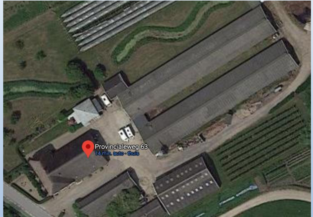
Asbest eraf zon erop, Provincialeweg, Schalkwijk, 660 panelen